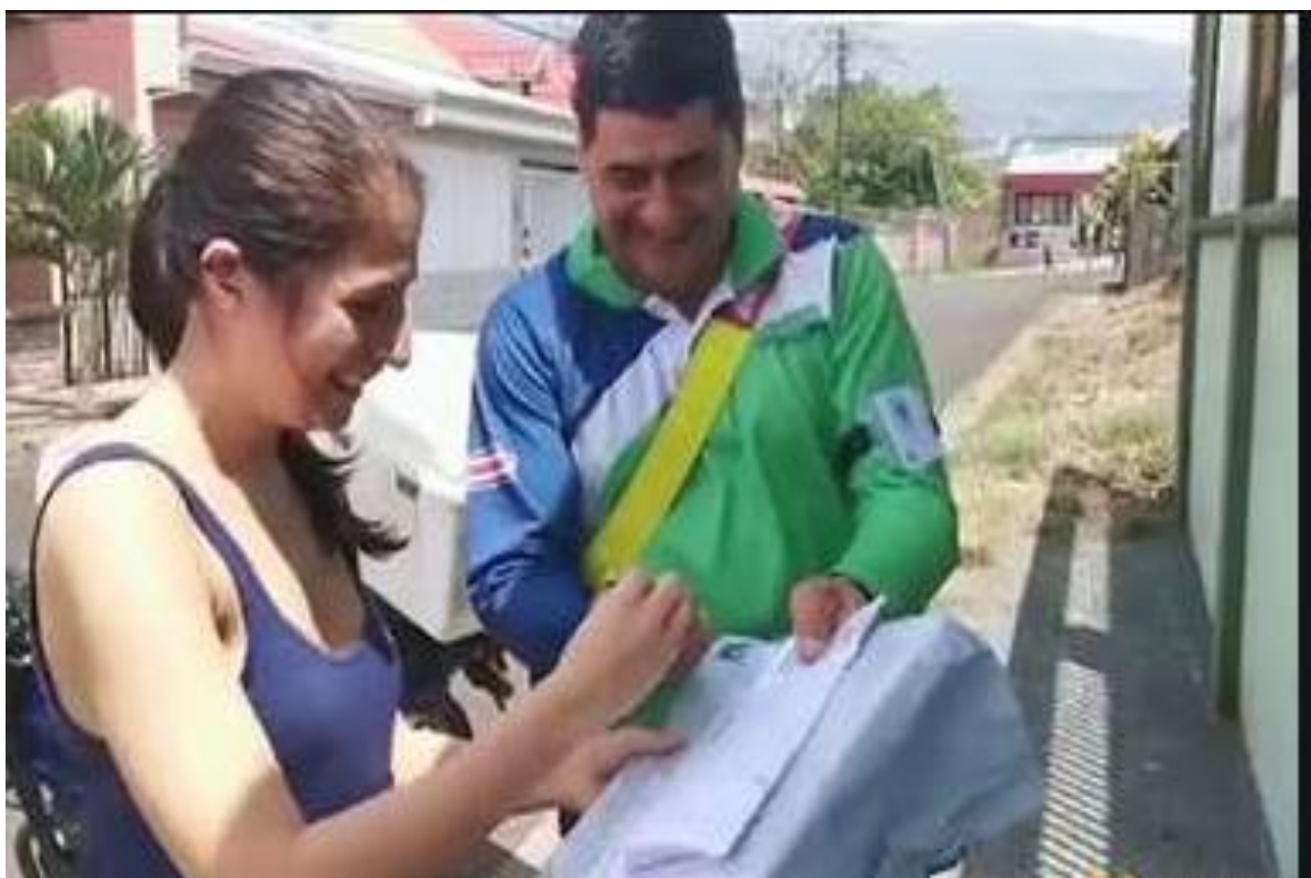
Fotografía con fines ilustrativos, fuente: página web Teletica.

Esta vez los estudiantes en sus hogares o centros de trabajo acompañados de sus familiares y/o amigos más íntimos juraron ante Dios y la sociedad frente a una pantalla para posteriormente esperar su ansiado título de la mano de un encargado de Correos Costa Rica quien sería el único testigo de ese primer contacto entre el estudiante y aquel cartón que representa alegrías, lágrimas y sacrificio.