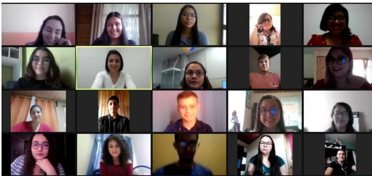
Fotografía con fines ilustrativos, fuente: página web UTN.

Sin aquel acostumbrado apretón de manos o el abrazo a su director de carrera, ni la mirada de satisfacción de los estudiantes perdida en búsqueda de sus familiares testigos de su reciente logro, esta vez solamente con la felicitación a dos metros de distancia del señor Decano, con la compañía de tan solo 4 de sus compañeros, una moderadora desconocida para ellos y con la sonrisa bajo un tapabocas concluirían su proceso ansiosos de salir por el portón a mostrar su título a los no presentes, quizás con una foto en la entrada o el jardín para el recuerdo de la histórica graduación en tiempos de COVID-19.