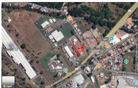
Sede de la organización

Fuente: Google Maps. Captura realizada el 19 de noviembre de 2024.