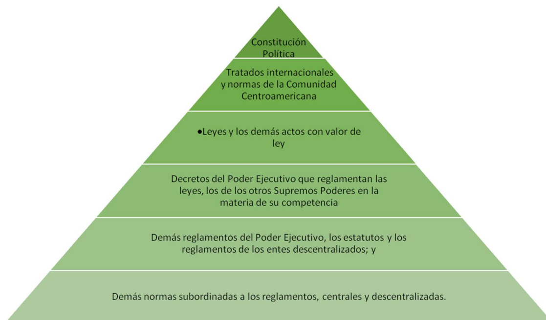
Figura 2 Pirámide de Kelsen