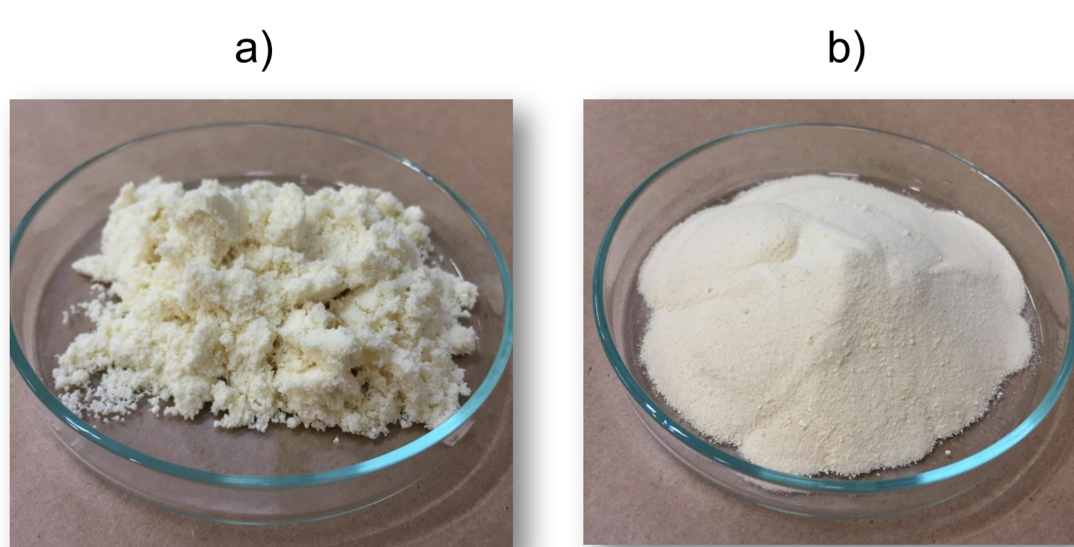
Fig. 1 Coproductos lácteos utilizados como fuente de carbono en un medio de cultivo alternativo para Mesohizobium huakuii Semia 6454 a) Calostro en polvo b) Permeado de suero en polvo

Los exopolisacáridos (EPS) son polímeros de carbohidratos producidos por microorganismos, con amplia variedad de estructuras y capaces de formar geles, emulsiones, aumentar viscosidad y biodegradables; podrían ser producidos a partir de coproductos industriales para reducir costos y mejorar características. El objetivo de este trabajo fue comparar parámetros de cultivo, rendimiento y comportamiento reológico de una solución acuosa de un EPS bacteriano producido en un medio con manitol y un medio con coproductos lácteos.