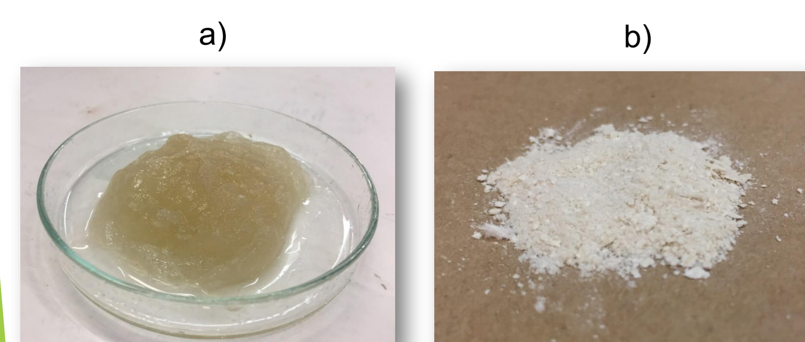
Fig. 2 Exopolisacárido producido por Mesohizobium huakuii Semia 6454 en el medio PC a) EPS recuperado de la precipitación por alcohol b) EPS dializado y liofilizado