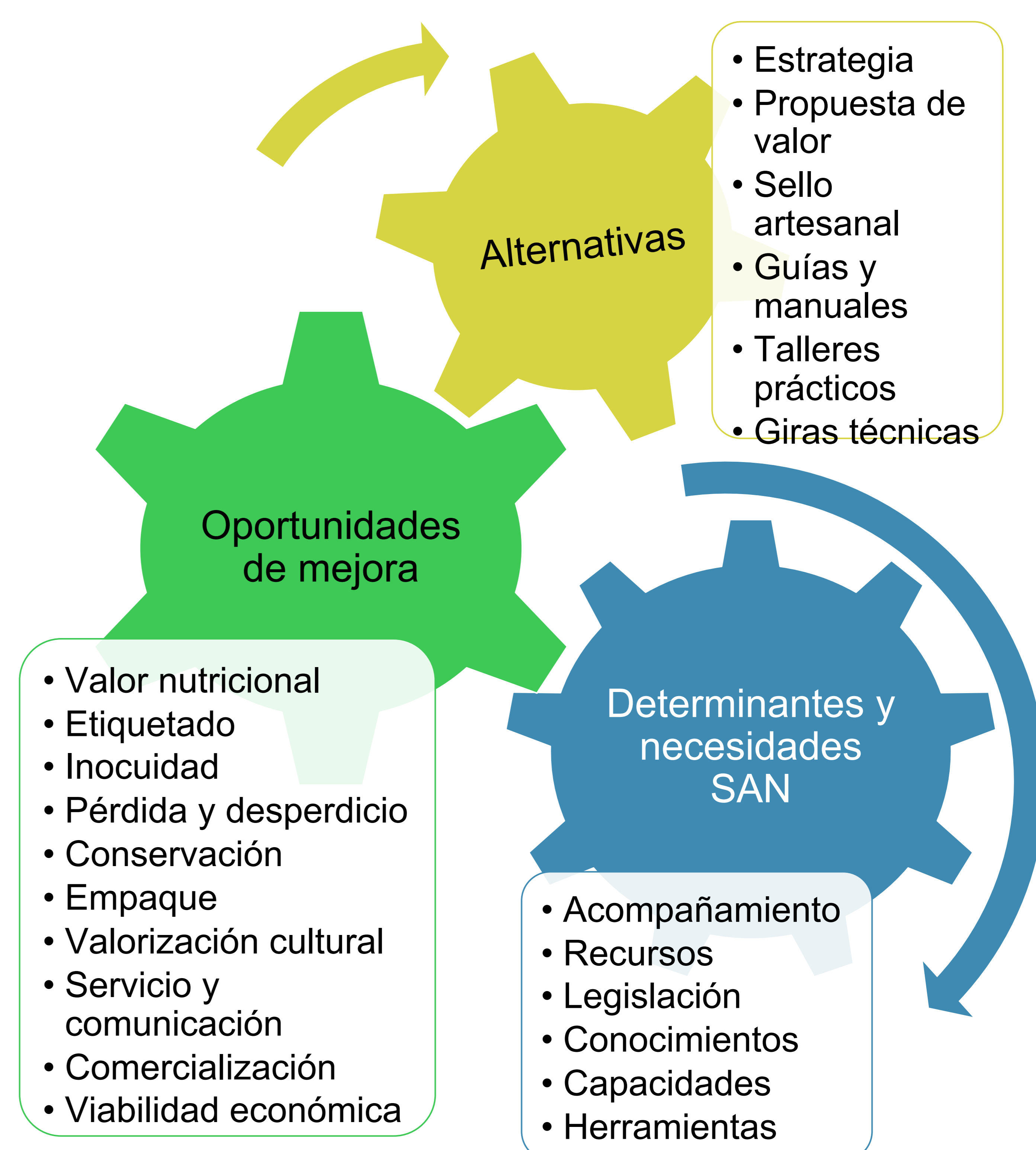
Figura 3. Principales resultados